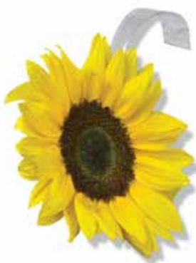
Woblery z tworzyw