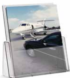
Podajnik na ulotki